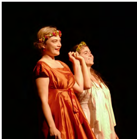
Birds on a wire