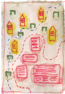
Un projet artistique multiple et situé